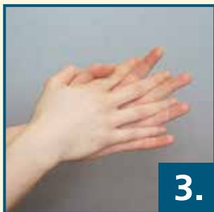
Handfläche auf Handfläche mit verschränkten Fingern