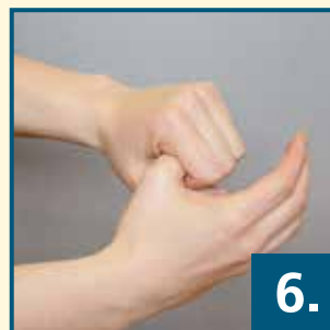
geschlossene Fingerkuppen in der Handfläche