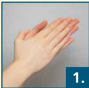
Handfläche gegen Handfläche