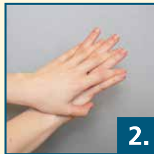
Handfläche über Handrücken