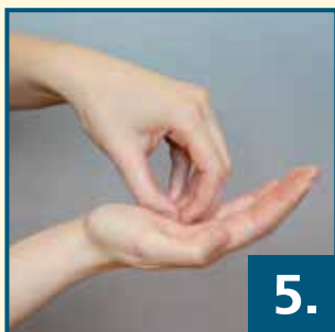
Daumen in der geschlossenen Handfläche